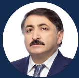
ГАСАНОВ ДЖАМАЛАДИН НАБИЕВИЧ

Депутат Государственной Думы ФС РФ, Председатель комитета Государственной Думы ФС РФ по труду, социальной политике и делам ветеранов