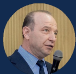
КВИНТ ВЛАДИМИР ЛЬВОВИЧ

Академик РАН, д.э.н., Лауреат высшей награды МГУ, член Президиума Международного Союза экономистов