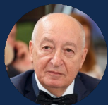
РЕНОВ ЭДУАРД НИКОЛАЕВИЧ

Депутат Государственной Думы ФС РФ, Заместитель Председателя Комитета Государственной Думы по науке и высшему образованию