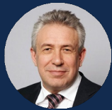
ГОРЬКОВ СЕРГЕЙ НИКОЛАЕВИЧ

Депутат Государственной Думы ФС РФ, к.ф.н.