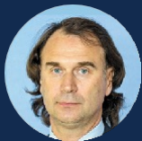
ЛИСОВСКИЙ СЕРГЕЙ ФЁДОРОВИЧ

Депутат Государственной Думы ФС РФ, к.п.н., Член Комитета Государственной Думы по безопасности и противодействию коррупции