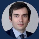
КОЛЕСНИКОВ МАКСИМ АНДРЕЕВИЧ

Первый заместитель министра экономического развития РФ