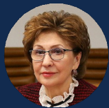
КАРЕЛОВА ГАЛИНА НИКОЛАЕВНА

Первый заместитель министра экономического развития РФ