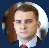
НИЛОВ ЯРОСЛАВ ЕВГЕНЬЕВИЧ

Депутат Государственной Думы ФС РФ, первый заместитель председателя Комитета Государственной Думы по охране здоровья, заслуженный врач РФ, д.м.н., профессор