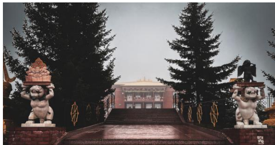
Экскурсия в Дацан Ринпоче-Багша

После окончания работы конференции (20 марта 2026 г., пятница) будет организована однодневная экскурсия «Питателиевские воды» за дополнительную плату. Стоимость 4000 руб., оплачивается до 2 марта (подробная информация на сайте конференции https://ginsoran2026.tilda.ws/excursion ).