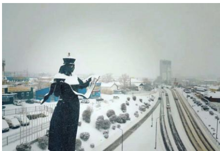
Экскурсия по г. Улан-Удэ