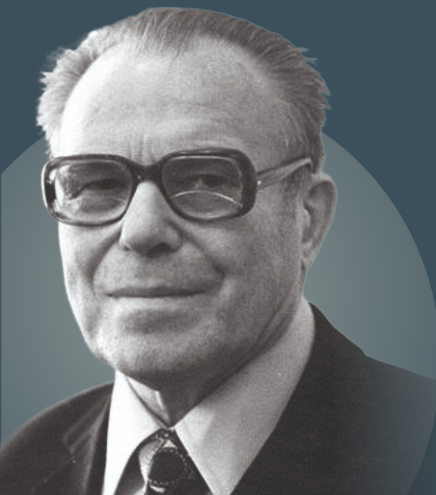
к 115-летию академика АН СССР и РАН А.А. Трофимука

МИНИСТЕРСТВО НАУКИ И ВЫСШЕГО ОБРАЗОВАНИЯ РОССИЙСКОЙ ФЕДЕРАЦИИ РОССИЙСКАЯ АКАДЕМИЯ НАУК СИБИРСКОЕ ОТДЕЛЕНИЕ РАН НАУЧНЫЙ СОВЕТ ПРИ ОНЗ РАН ПО ПРОБЛЕМАМ ГЕОЛОГИИ, ГЕОФИЗИКИ, РАЗРАБОТКИ И ПЕРЕРАБОТКИ УГЛЕВОДОРОДОВ НОВОСИБИРСКИЙ НАЦИОНАЛЬНЫЙ ИССЛЕДОВАТЕЛЬСКИЙ ГОСУДАРСТВЕННЫЙ УНИВЕРСИТЕТ ИНСТИТУТ НЕФТЕГАЗОВОЙ ГЕОЛОГИИ И ГЕОФИЗИКИ ИМ. А.А. ТРОФИМУКА