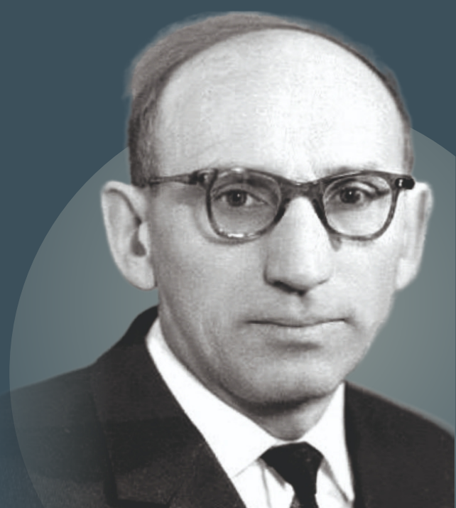
к 105-летию заслуженного деятеля науки РСФСР В.С. Вышемирского